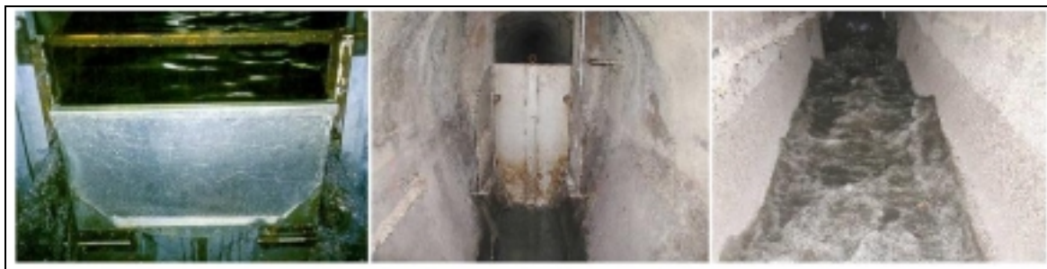
Figure VII-5 - Vanne Hydrass en fonctionnement à Paris (à gauche) et à Marseille (au milieu, à droite)

Des systèmes de vannes automatiques "Hydrass" (cf. Figure VII-5) sont aussi utilisés sur de petits collecteurs. En position fermée la vanne retient les eaux jusqu'à un seuil. Quand le seuil est atteint, la vanne bascule et libère la quantité d'eau stockée derrière la vanne pour assurer un nettoyage de l'aval par effet de chasse.