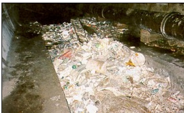
Figure VII-4 - Exemple de collecteur envahi par des "flottants"

Les gestionnaires du réseau parisien connaissent depuis longtemps les problèmes liés aux dépôts. Les "sables" sont constitués par des solides, de différentes nature, qui s'accumulent dans les ouvrages du réseau d'assainissement et qui sont à l'origine de dysfonctionnements du réseau : modification de l'hydraulique, obstruction de canalisations, dégagements de gaz toxiques. La donnée d'ensablement est entrée dans une base de données appelée TIGRE par les égoutiers de la Ville de Paris au cours de leurs visites dans le réseau. Cette donnée peut être entrée sur des pas de 50m, voire de 10m. Elle se présente sous la forme d'une hauteur de dépôt avec la possibilité de distinguer différents types de dépôts : sables, boues, graisses, flottants,...(cf. Figure VII-4). Le service de la Ville de Paris peut ainsi évaluer les volumes de dépôts présents dans les collecteurs et prévoir des campagnes de curage pour remédier aux situations critiques.